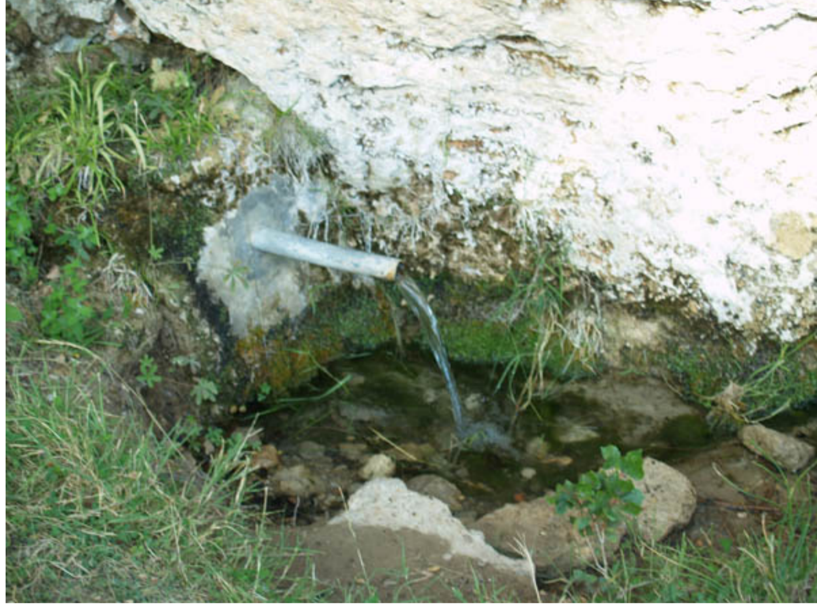
Así se mantiene el depósito, a pesar de las riegas.